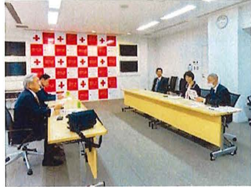
義援金を日本赤十字社 千葉支部にお届けしました